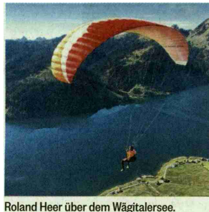
Roland Heer über dem Wägitalersee.

Die Wiese auf dem Bockmattli war bereits herbstlich-braun verfärbt, als Scheel und Heer starteten. Sie flogen an den Bockmattli-Türmen vorbei bis zum Wägitalersee, um schliesslich oberhalb von Innerthal wieder Boden unter die Füsse zu bekommen. Nur gerade zwei Tage später verschwand der Gipfel des Bockmattlis unter einer Schneedecke – vorübergehend.