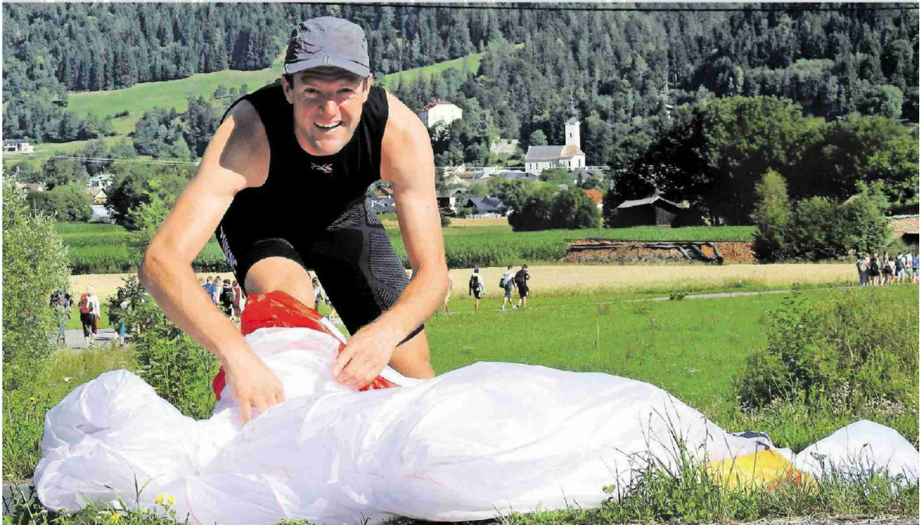
Der fünffache X-Alps-Sieger Chrigel Maurer in der Anfangsphase des letztjährigen Rennens, nachdem er im oberbayrischen Bayerischzell gelandet ist.